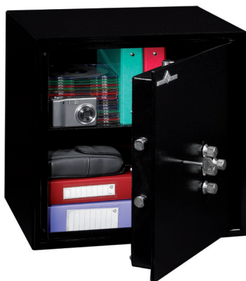
HT 50 1 tablette réglable en hauteur au pas de 40 mm.