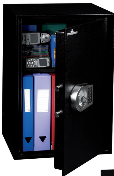
HT 70 1 tablette réglable en hauteur au pas de 40 mm.

Protection anti-effraction norme européenne EN 14450. Classe S1 (uniquement les modèles avec serrure à clé) Blindage anti-perçage au manganèse du système de condamnation.