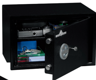
HT 15 1 tablette réglable en hauteur au pas de 40 mm.