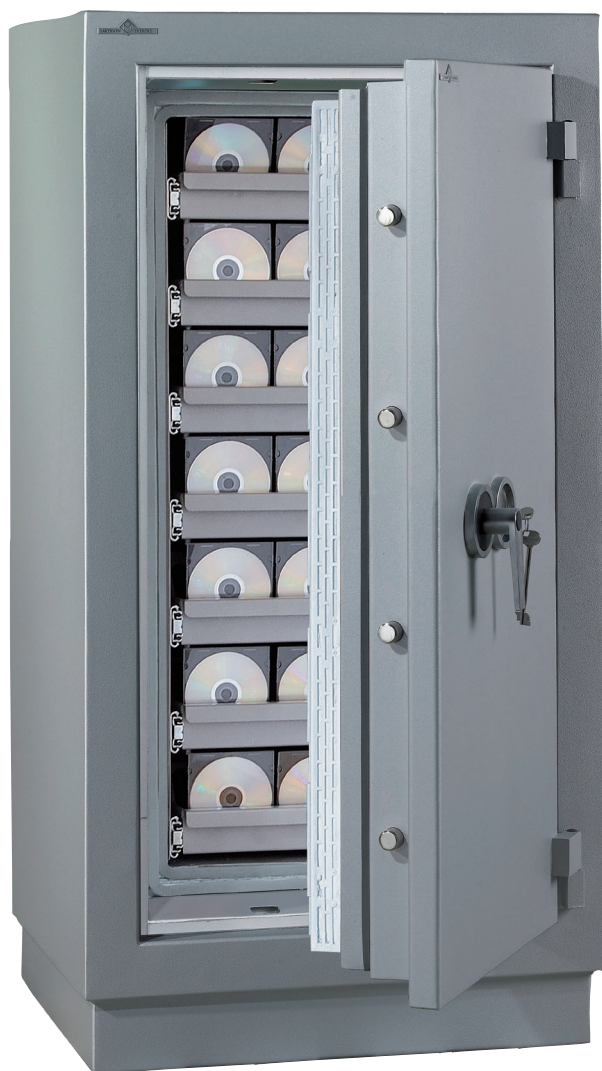
MÉDIA DUO 1280