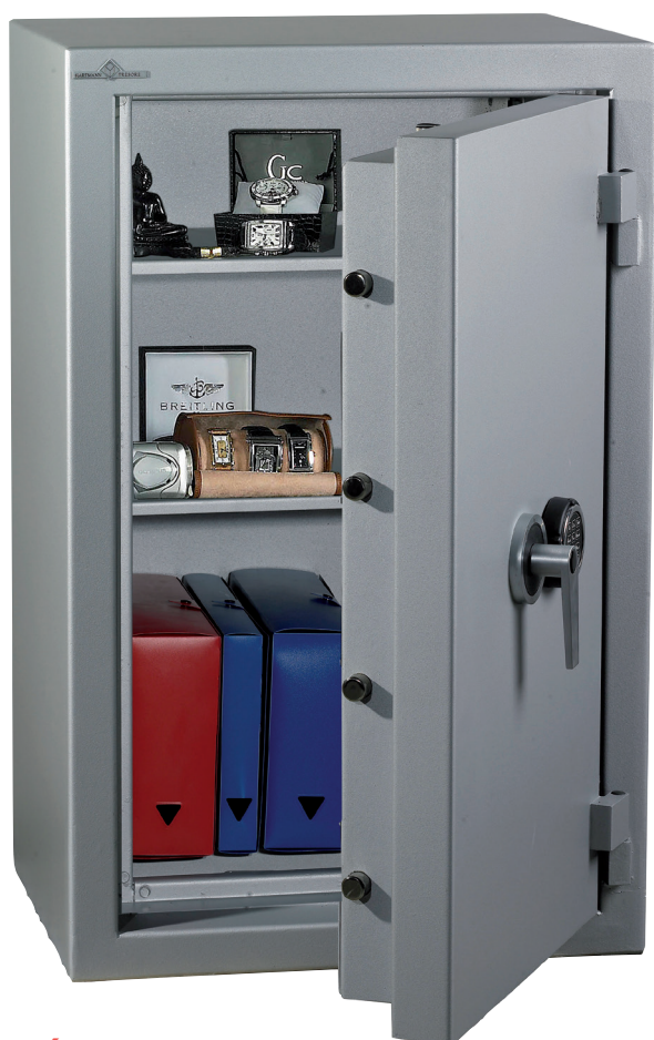
ZÉPHIR DUO 3123

ZEPHIR CLASSE 3 / VALEUR ASSURABLE : 55 000€.