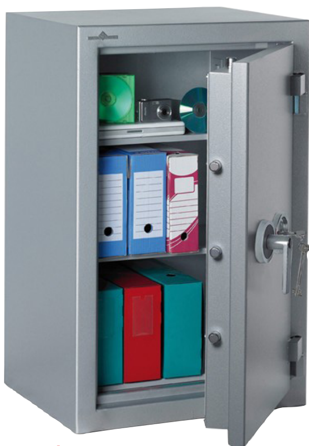
ZÉPHIR DUO 1149

Ignifuge papier 30 minutes • Norme européenne EN 15659 - Label S30P